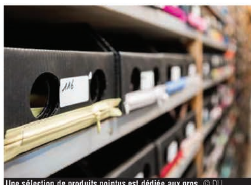
Une sélection de produits pointus est dédiée aux pros.