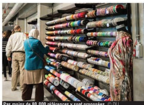
Pas moins de 80.000 références y sont proposées.